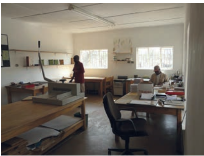
Und auch in der Buchbinderei produzieren drei Kriegsversehrte nach wie vor Schönes und Nützliches

alleinige Verantwortung dafür liegt in der Hand der sich einmietenden Einzelorganisationen. Lediglich die Buchbinderei, die übrigens seit einiger Zeit nahezu kostendeckend arbeitet, wird weiterhin von der HBF geführt.