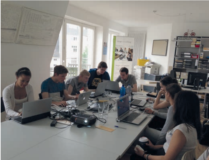
Beim Abschlussworkshop des b:s:c-Jahrganges 2013 wurde fleißig gearbeitet.

Im Frühjahr diesen Jahres verabschiedete die bürger:sinn:stiftung den dritten Jahrgang der bürger:sinn:company. Während eines letzten Workshops in den Stiftungsräumen über den Dächern des Kreuzviertels zog die Runde der ausscheidenden b:s:cler gemeinsam mit Projektleiter und Mentoren eine Bilanz der gemeinsamen Zeit.