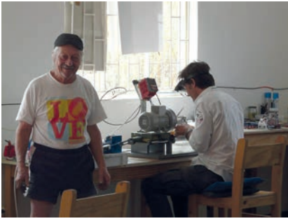
Die Steinschleifer haben auf Baumgartsbrunn ihre Werkstatt eingerichtet