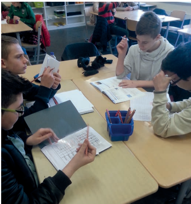
Die Hauptschüler sind konzentriert bei der Sache

Schon beim ersten Durchgang des b:s:c-Grundseminars Wirtschaft im Jahre 2008 wurde der Entschluss gefasst, später auch den Weg in die Hauptschulen zu suchen und dies namentlich in jenen Münsteraner Stadtteilen, in denen das Überschuldungsproblem am größten ist. Die Stadtteile Coerde (Überschuldungsquote aller Haushalte: knapp 14%) und Kinderhaus (sogar mehr als 14%) fielen hier erst kürzlich wieder besonders auf. Allerdings wollten die b:s:cler das Grundseminar zunächst mit Gymnasiasten erproben, weil sowohl die Jungunternehmer als auch ihre Mentoren mit dieser Zielgruppe mehr Erfahrung hatten.