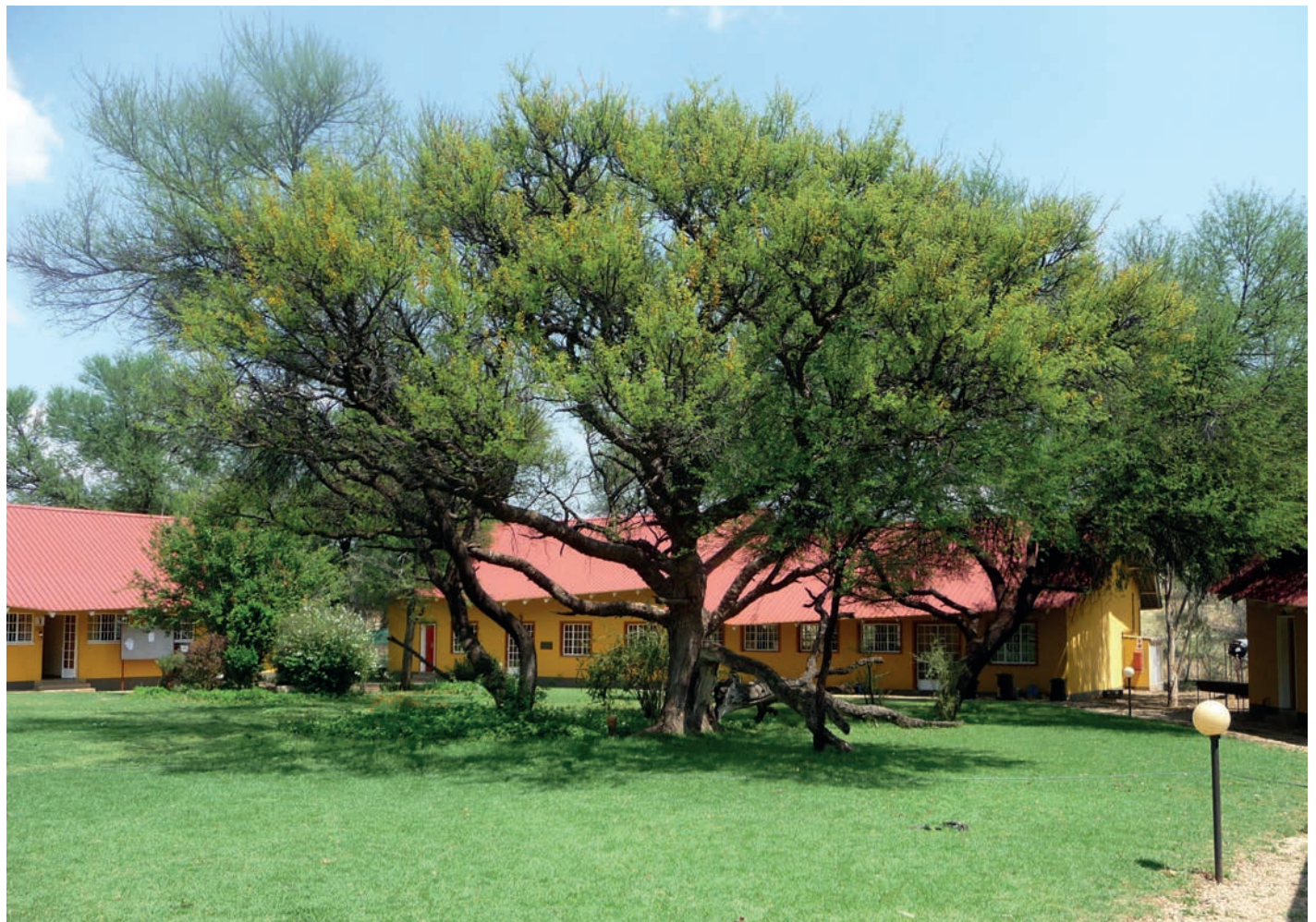
Gebäude und Anlagen konnten erhalten werden

Um es bildhaft auszudrücken, viele Hände streckten sich aus, um das Kleinod Baumgartsbrunn zu übernehmen, diese Hände zuckten aber zurück, als es darum ging, finanzielle und gestalterische Verantwortung mit zu übernehmen. Daher zogen sich die Verhandlungen hin.