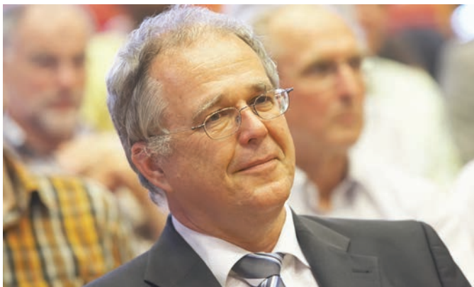
Prof. Wolfgang Fiegenbaum.

Warum höre ich auf? Wie alles im Leben einmal zu Ende geht, so hatte auch ich das Gefühl, nichts Wesentliches mehr zur Arbeit der Stiftung beitragen zu können. Neue und junge Leute sind für eine notwendige Weiterentwicklung der Stiftungsarbeit gefragt und stehen zum Glück bereit.