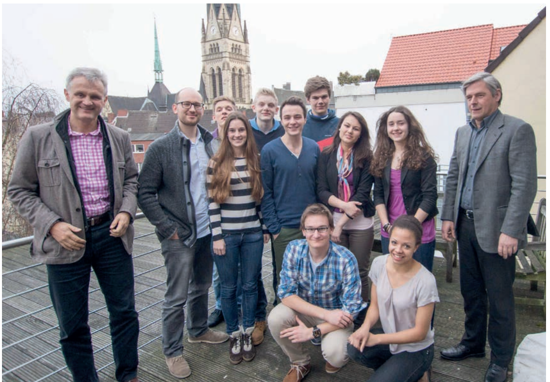
Der b:s:c-Jahrgang 2013 mit Projektleiter und Mentoren

Gemeinsam verbrachte man ein bis zwei Jahre in der b:s:c. Am Ende standen viele gemeinsame Erfahrungen, eine umfassende Bilanz und ein solides Fundament für den neuen, den vierten Jahrgang der bürger:sinn:company, der gerade an den Start geht. Und es gab ein Versprechen: Der bürger:sinn:stiftung verbunden zu bleiben und im Alumni-Netzwerk für die Ehemaligen der b:s:c aktiv mitzuarbeiten. Die Gelegenheit dazu ergibt sich schon bald: Beim inzwischen schon traditionellen Alumni-Treffen im Dezember werden sich alle wiedersehen.