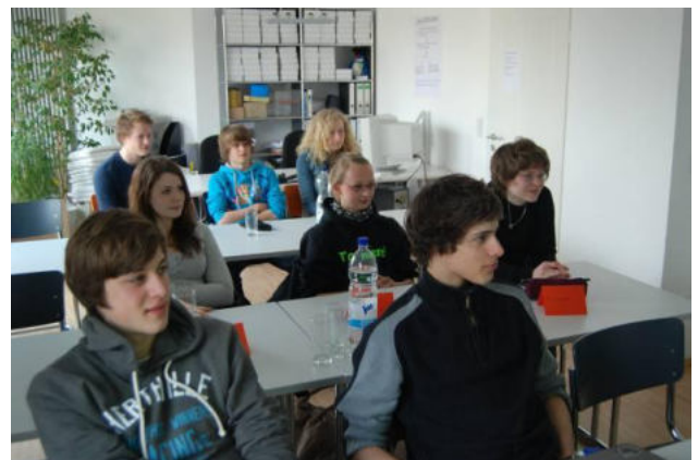
Das außerschulische Lernangebot der b:s:c findet große Resonanz.

Schon jetzt nimmt die bürger:sinn:company planungssichernde unverbindliche Voranmeldungen für den vierten Durchgang an. Dieser startet voraussichtlich im September 2010.