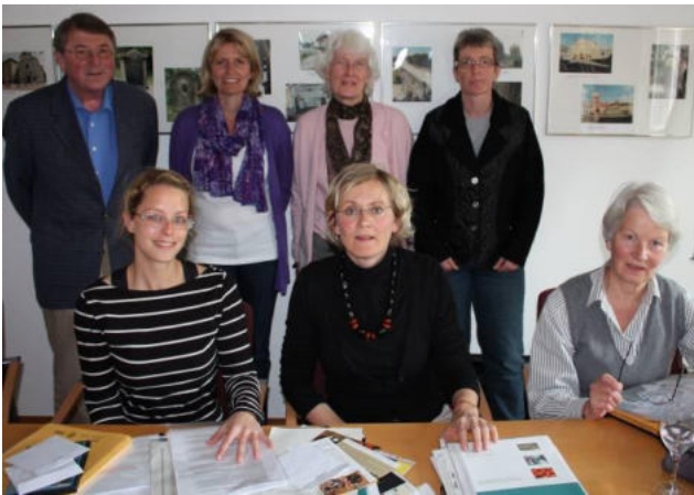
Erwartungsvoll nimmt die Jury die eingereichten Unterlagen entgegen.

„Jedes Mitglied der Jury legt auf einen bestimmten Aspekt besonders viel Wert, das eine z. B. auf die Einbindung ehrenamtlicher Kräfte, das andere auf die Aufklärungsarbeit, und ein drittes hält insbesondere die Möglichkeit der Nord-Süd-Begegnung für wichtig. Indem jeder seine Perspektive erläutert, sind die jeweils Anderen dazu angehalten, ihre eigene Beurteilung noch einmal „abzuklopfen“ und ggf. durch Aspekte, die man bisher vielleicht gar nicht so gesehen hat, neu zu justieren. Ich selbst, als Vertreterin der bürger:sinn:stiftung, lege bei der Beurteilung z. B. besonderes Augenmerk darauf, ob das Projekt darauf abzielt (...) Hilfe zur Selbsthilfe zu leisten und das auf Augenhöhe mit dem Partner aus dem Entwicklungsland.“