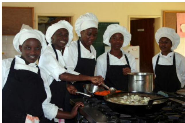
Vorbereitung zum Start ins Praktikum.

In Gesprächen mit den Managern der Lodges und Hotels hörte ich fast nur Positives. Die jungen Frauen seien sehr tüchtig, wissbegierig und freundlich.