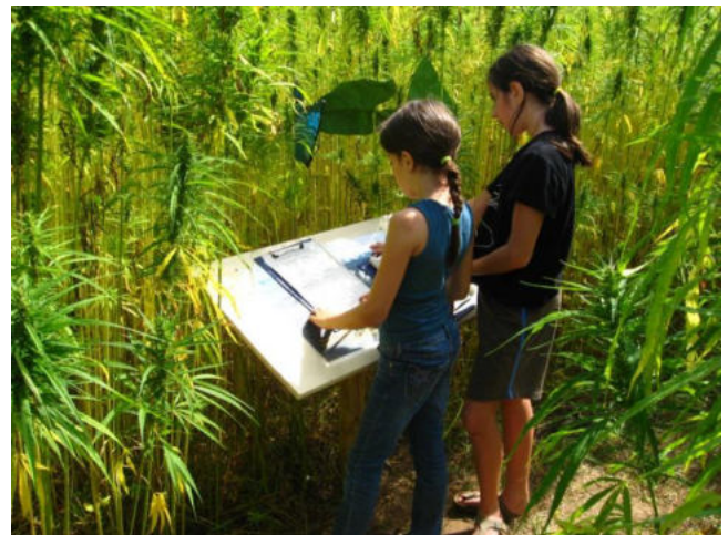
Dialog mit der Natur

Die acht- bis zwölfjährigen Kinder konnten das Labyrinth eigenständig in Gruppen durchstreifen und wurden von Fragen, Infotafeln und Mitmachstationen geleitet. Dabei erfuhren die Kinder viel über die Geschichte zur Herstellung und Herkunft von Alltagsgütern, z. B. wo die Tomaten herkommen, die wir billig kaufen, oder wie viele tausend Kilometer eine Jeans hinter sich hat, bevor sie in Münster verkauft wird. Auf diese Weise wurden die Kinder (und Begleitung) angeregt, das eigene Handeln zu überdenken, mitzugestalten und Verantwortung zu übernehmen.